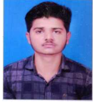
Photo & Specimen Signature of the Candidate