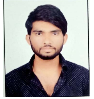
Photo & Specimen Signature of the Candidate