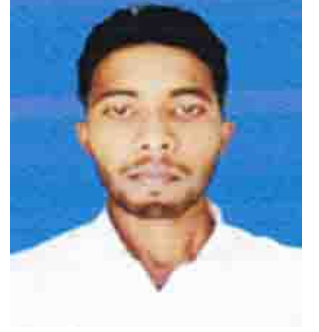
Photo & Specimen Signature of the Candidate