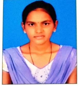
Photo & Specimen Signature of the Candidate